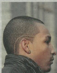
Uno dei lavori di Emma Ciceri

A PORDENONE. Sono oltre un migliaio i visitatori de 'La bottega del sacro di Tiburzio Donadon: il maestro e Giancarlo Magri, l'ultimo garzone', fino al 25 gennaio nel Convento di san Francesco. A corredo dell'iniziativa che documenta 100 anni di arte sacra a Pordenone, sabato 18 un convegno su 'Il cardinale Celso Costantini', per far conoscere alle nuove generazioni il grande patrimonio artistico delle nostre terre.