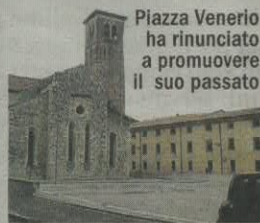
Piazza Venerio ha rinunciato a promuovere il suo passato